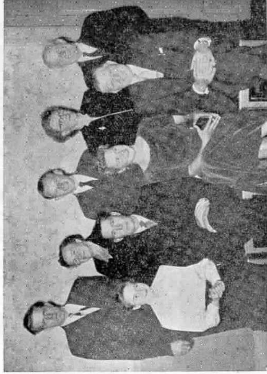
Foreningens nuværende Bestyrelse.