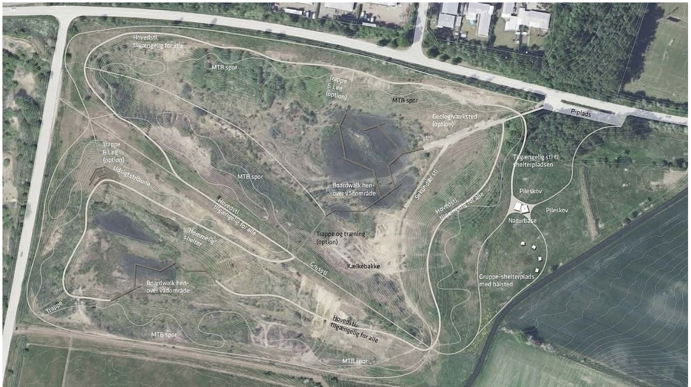
Kort over grusgraven med de kommende projekter tegnet ind. Foto: Spektrum Arkitekter