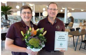
Ejerne af Dyrehøj Vingård

ger på det solrige Røsnæs og er Danmarks langt største vingård med over 40.000 planter på 10 hektar. Her får vi serveret hele syv anretninger. Efter den overdådige frokost skal vi vises rundt i vineriet, hvor der arbejdes intenst med at udvikle og tilvejebringe egnsprægede vine. Dette arbejde har udmøntet sig i flere præmierede mousserende, hvide og rosévine.